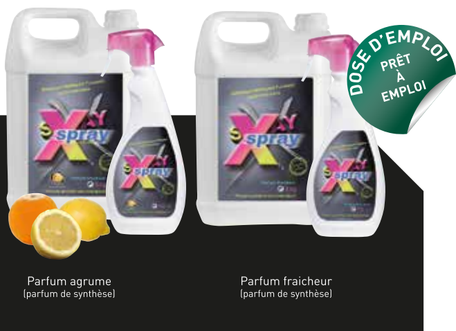
Parfum agrume (parfum de synthèse)