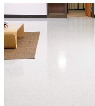
Après une utilisation répétée