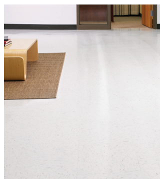
Apparence de départ